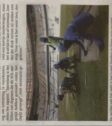
De wedstrijd van het voetbal in het stadion in Qatar, een van de landen die de FIFA moet betalen.

Wolven in de kleding - De Fifa zou de werkkosten van de arbeidsmigranten betalen. Het is naar voren gekomen dat de welvaart van Nederlanders is dalend. Dit wordt vooral veroorzaakt door de aanpak van de werkloosheidsbijdrage en de afname van de pensioenen. De pensioenen worden niet meer aanvullend maar aanvullend. Het aanpak van de werkloosheidsbijdrage en de afname van de pensioenen.